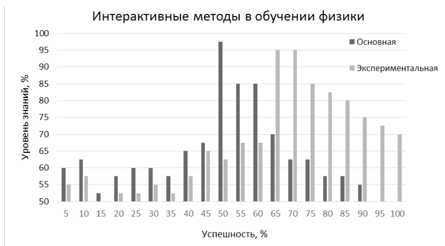
Рисунок 1 – Сравнительная гистограмма, показывающая общий уровень знаний у студентов

обучения. Мы считаем, что благодаря модификации интерактивных методов можно добиться намного большего эффекта.