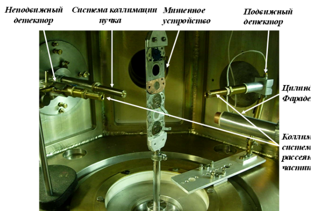
Рисунок 1 – Внутренний вид центральной камеры использовавшейся для экспериментов

В качестве мишени использовалась пленка TiN с естественным изотопным составом азота ( ^{14}\text{N} - 99,634\% ) и титана ( ^{46}\text{Ti} - 8.2\% , ^{47}\text{Ti} - 7.4\% , ^{48}\text{Ti} - 74\% , ^{49}\text{Ti} - 5.4\% и ^{50}\text{Ti} - 5.2\% ), изготовленная методом магнетронного напыления. Энергетические потери протонов с E_{p,\text{лаб.}} = 0.992 МэВ при прохождении мишени (TiN) определялись сдвигом резонанса реакции ^{27}\text{Al}(p,\gamma)^{28}\text{Si} при E_{p,\text{лаб.}} = 0.992 МэВ [8,9] и оказались равными (8.5 \pm 1.5) \cdot 10^{-3} МэВ. Такая толщина мишени удовлетворяла требованиям механической и термической прочности, и в тоже время, практически не влияла на уширение спектральных линий, за исключением линий спектров, полученных под \theta_{\text{ц.м.}} = 73.8^\circ, 84^\circ, 94.1^\circ, 104^\circ , где уширение обусловленное толщиной мишени равно уширению за счет энергетического разрешения детектора.